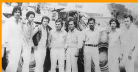
Los Juveniles na Boneiro

Cu Elvia por corda, ta cu Los Juveniles, nan a presenta cu hopi exito na Corsou y na Boneiro. Despues Los Pimentosos a presenta na Berlin (Alemania) y na Hulanda. Los Pimentosos a presenta na Colombia, riba e Plaza Francisco el Hombre durante un festival di vallenato masha reconocí na Valledupar Colombia. Na aña 1994 Vicente a presenta na e festival vallenato, riba invitacion di, e tempo aya e minister di cultura Consuelo Araújo Noguera (dfm), kende tabata presidente tambe di e Fundacion festival vallenato cu ta